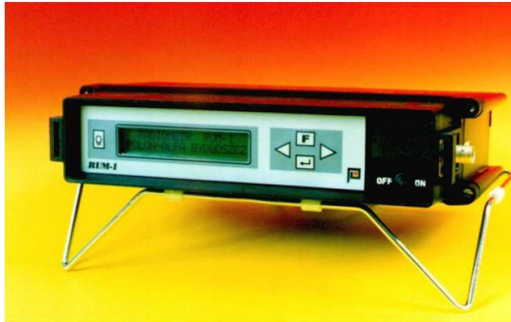
Rys. 1. Zdjęcie układu pomiarowego